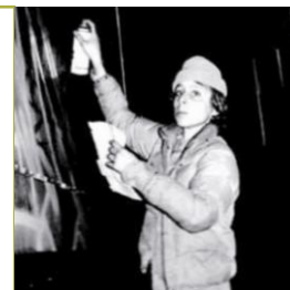
Min, © Henry Chalfant ADG, © Pierre Guillien

Les pressions, de la bombe, de la rue, des artistes entre eux, de la société et du public, définies par certains artistes comme à la source de la puissance et de l'énergie de leurs réalisations, ont conduit à nommer « Pressionnisme » ou « Pressure Art » ce mouvement pictural sur toile, désormais inscrit dans l'histoire de l'Art.